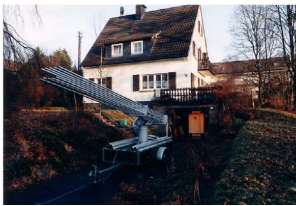
Оргонното оръдие на Райх, с което се е опитвал да повлияе на бурите и дъждовете

Кого устройват тези лъжи? Нали уж отдавна всички знаем истината! И отново излиза наяве абсурдният факт, че това устройва почти всички обществени слоеве. Защото, за да живее истински, на човек му се налага да премине отвъд териториите, заразени от емоционалната чума. Да разчупи патологичната броня на характера си, която го отделя от света, да прозре нищетата на предразсъдъците, на псевдоморала и фалша на много от обществените норми, да си признае най-сетне, че политическите търсения на спасителни решения търпят провал след провал. Обаче това е опасно за равновесието. И тук вече, макар и все така парадоксално, чумата започва да изглежда като спасение, въпреки че всички си дават сметка за многобройните и лица – депресиите, меланхолиите, зависимостите, обсеиите и фобиите, садизмът и жестокостта във всичките им разновидности. И накрая огромния паноптикум от психо-соматични разстройства... Това е само малка част. Резултатът от равносметката някой ден, когато нищо вече не може да се промени, в повечето случаи е един жалък и пропилян живот. “Лъжата, че сме живели!” – както възкликва с горчивина друг писател.