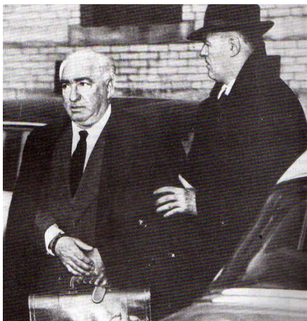
Една от последните снимки на В. Райх. Деня на арестуването му.

И нека се върнем още веднъж към чумата, чиято зараза и Камю, и Райх видяха в човешката култура. Как се проявява тя там, където отношенията в групата по принадлежност би следвало да водят към хармония и любов, към пълноценен живот? Съвсем накратко: Розенберг, един от помощниците на Хитлер, по време на нюрнбергския процес отговаря на въпроса как си представя пълноценния живот: „Това е стилът на марширува-