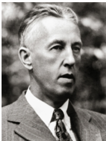
Уилям Грифит Уилсън Бил У.

за евангелистите, а не да създават АА. По-късно крилото става известно като „алкохолната клонка” на оксфордското движение.