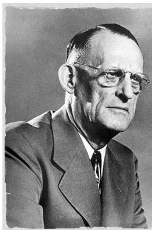
Робърт Смит (Д-р Боб)

И тук възниква важният въпрос: защо точно Оксфордската група? Сюзън Чийвър, авторка на нашумялата биография на Бил Уилсън „Казвам се Бил У.” (My Name Is Bill W), се опитва да даде своеобразен, малко романтичен отговор на този въпрос 17 . Тя прекарала доста време в щата Върмонт, където е роден Бил Уилсън. Доктор Боб също е от Върмонт. Според нея много културни и психологически нишки, отвели двамата до „Оксфордската група”, а по-късно и до „Анонимни Алкохолици”, започват от там. Там според нея все още са близо един до друг „тези раздалечени другаде брегове на религия, мистика и трансцедентализъм”. Това е мястото, където и до днес се изповядва мистичната философия на Дейвид Торо и Ралф Емерсън. „Бог, така както го разбираме” е идеал на вярата при Торо. Там, във Върмонт, в Ню Хемпшир, в провинциите около Ню Йорк хората още имат различни видове богове – калвинистки, пуритански, католически. И много трансцедентализъм, което е типично и за „Стъпките”. Свят, все още потънал в свръхестественото, в който цари необуздан спиритуализъм – дори образованието на децата е базирано на спиритуализма. Границата между живите и мъртвите не винаги е ясна, а движението за трезвост играе критична роля. В „Историята на Бил” 18 , Бил Уилсън си спомня същото: „Открай време вярвах в Сила по-висша от мен... аз не се съмнявах, че в основата на мирозданието има таен смисъл и ритъм.” И